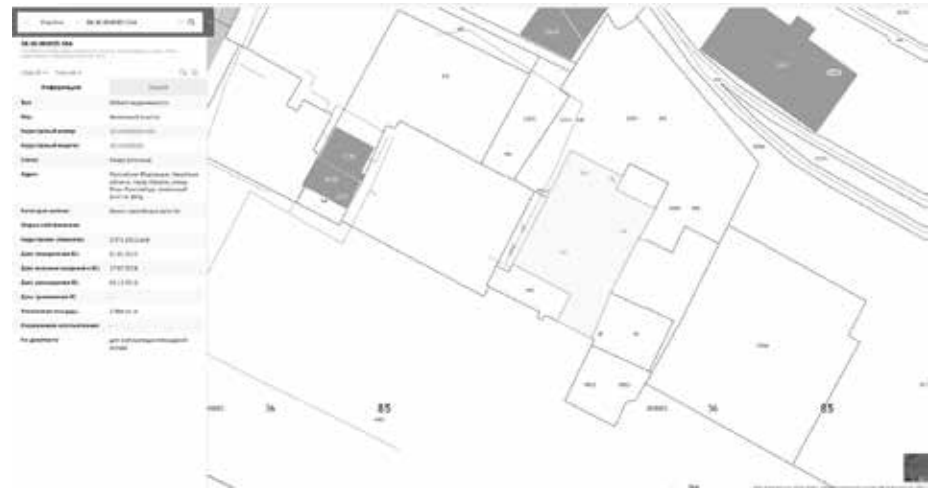
СХЕМА РАСПОЛОЖЕНИЯ ЗЕМЕЛЬНОГО УЧАСТКА, В ОТНОШЕНИИ КОТОРОГО ПОДГОТОВЛЕН ПРОЕКТ РЕШЕНИЯ О ПРЕДОСТАВЛЕНИИ РАЗРЕШЕНИЯ НА УСЛОВНО РАЗРЕШЕННЫЙ ВИД ИСПОЛЬЗОВАНИЯ «ЗДРАВООХРАНЕНИЕ» В ОТНОШЕНИИ ЗЕМЕЛЬНОГО УЧАСТКА С КАДАСТРОВЫМ НОМЕРОМ 38:36:000005:564, ПЛОЩАДЬЮ 2390 КВ. М, РАСПОЛОЖЕННОГО ПО АДРЕСУ: РОССИЙСКАЯ ФЕДЕРАЦИЯ, ИРКУТСКАЯ ОБЛАСТЬ, ГОРОД ИРКУТСК, УЛИЦА РОЗЫ ЛЮКСЕМБУРГ, ЗЕМЕЛЬНЫЙ УЧАСТОК 182Д.

Учитывая запрос Общества с ограниченной ответственностью «Лаборатория имени Святителя Луки» о предоставлении разрешения на условно разрешенный вид использования земельного участка, предоставить разрешение на условно разрешенный вид использования «Здравоохранение» в отношении земельного участка с кадастровым номером 38:36:000005:564, площадью 2390 кв. м, расположенного по адресу: Российская Федерация, Иркутская область, город Иркутск, улица Розы Люксембург, земельный участок 182д.